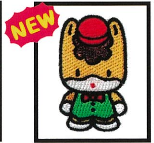
2 赤帽子ぐんまちゃん