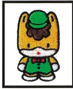
1 緑帽子ぐんまちゃん